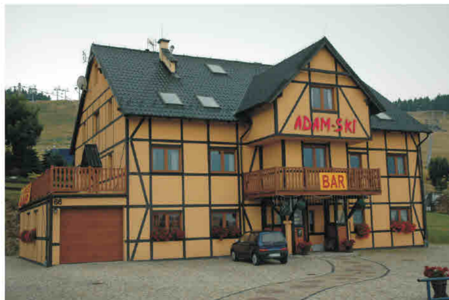
Zieleniec (Duszniki Zdr) - pensjonat z lat 90 XX w. Imitacja konstrukcji ryglowej w formie dekoracji malarskiej.

Woldenstein/ Włodowice - Wohngebäude in einem Gehöft aus der Wendezeit des 19./20. Jahrhunderts. Fachwerkimitation mit Hilfe eines dekorativen Farbanstrichs