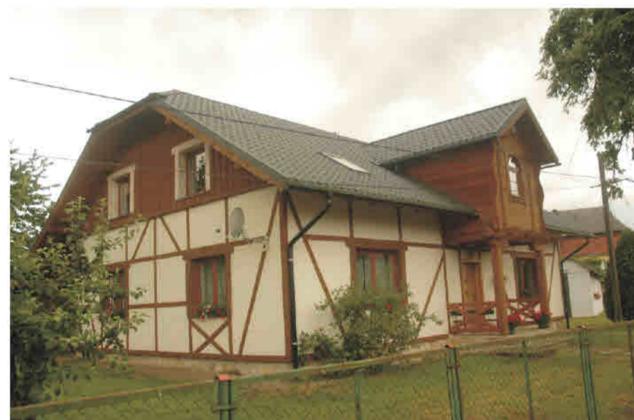
Krosnowice - bud. jednorodzinny imitacja - deski na tynku, faktura tynku imituje wypełnienie szachulcem. Forma wyżki inspirowana stylem lokalnym.

Häufige Begründung: Überzeugung des Eigentümers von den Verbindungen der Fachwerkbauweise zur regionalen Baukunst des Glatzer Landes