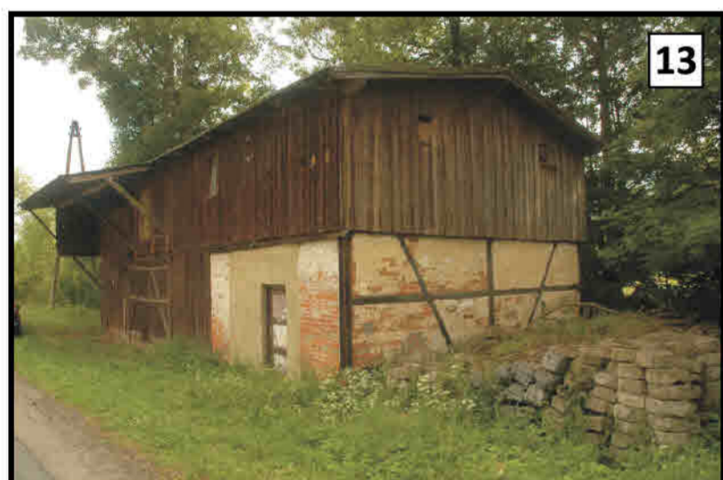
13 Starkówek - ściana ryglowa wolnostojącej szopy. Neubatzdorf/ Starkówek - Fachwerkwand einer freistehenden .