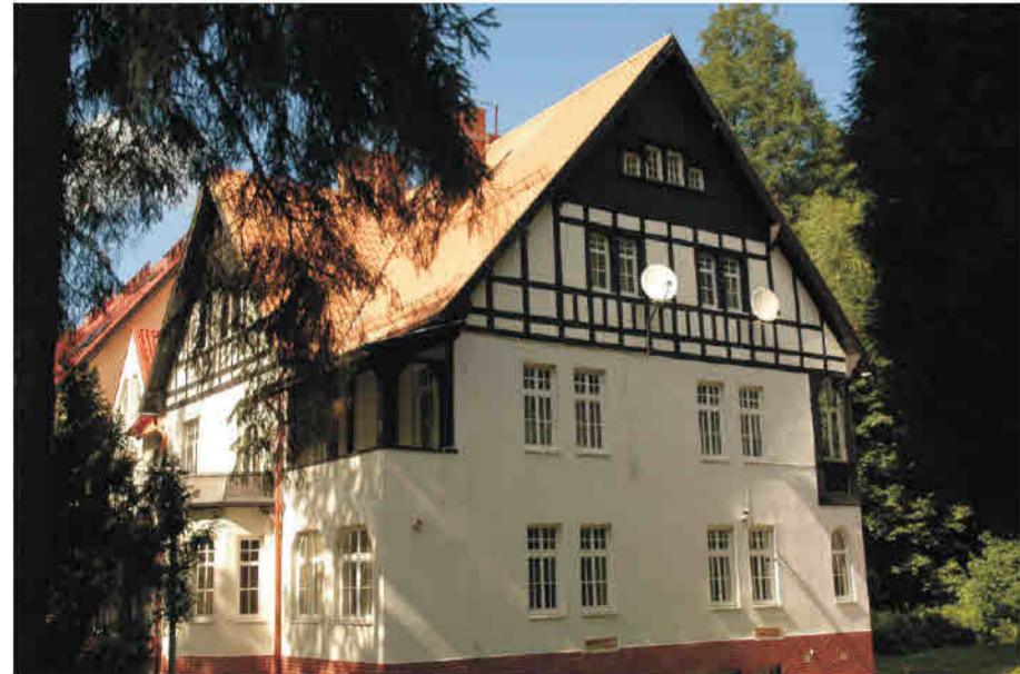
Duszniki - Zdrój - budynek uzdrowiskowy z przełomu XIX/XX w. Bad Reinerz/ Duszniki Zdrój - Bädergebäude aus der Wendezeit des 19./20. Jahrhunderts

Lageräume, Fabrikhallen, technologische Objekte (Getreideaufzüge), Bauten der Eisenbahninfrastruktur. Objekte aus der zweiten Hälfte des 19. und dem Beginn des 20. Jahrhunderts. Die Fachwerkkonstruktion dient in diesen Fällen technischen Zwecken sowie der Vereinheitlichung und visuellen Identifikation von Objekten mit derselben Funktion (z.B. der Bahnhofgebäude an der Eisenbahnstrecke Glatz/ Kłodzko - Seitenberg/ Stronie Śląskie)