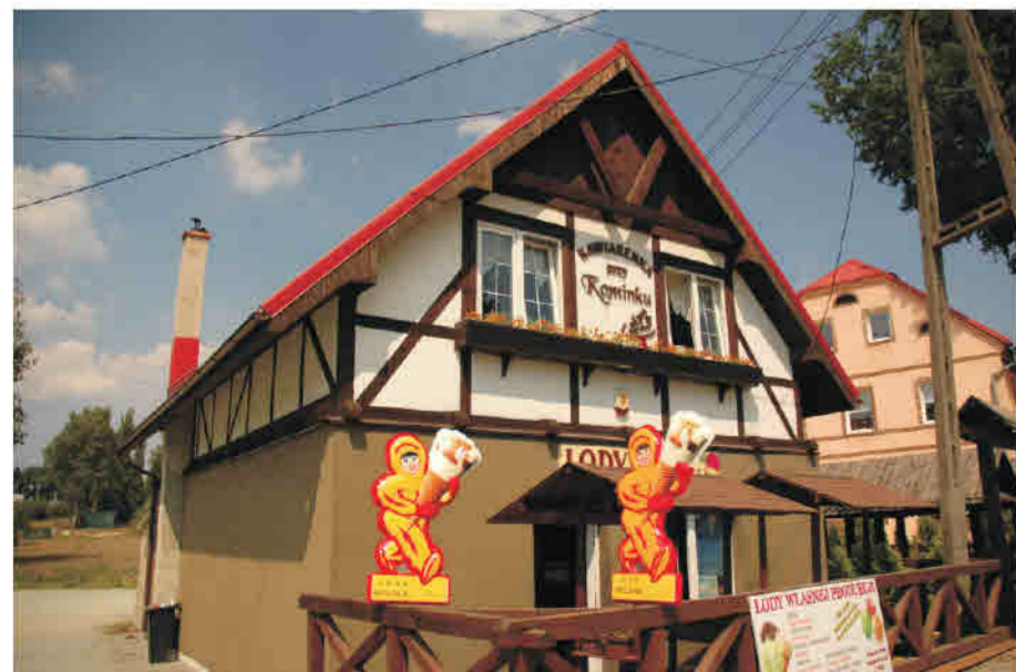
Nowa Ruda - Stupiec - obiekt usługowy nawiązujący do cech regionalnych pogranicza kłodzko-wałbrzyskiego, konstrukcja ryglowa w poziomie piętra

Alt Weistriz/ Stara Bystrzyca - Ehemaliger Krug aus dem 19. Jahrhundert, in den 1990er Jahren zu Wohnzwecken umgebaut; Ausschmückung des Obergeschosses in Form einer Fachwerkkonstruktion.