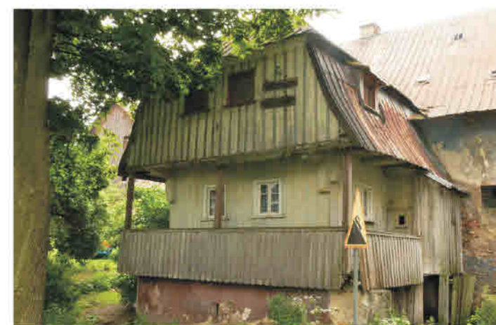
Nowa Bystrzyca - facjotka w konstrukcji wieńcowej otoczona galerijką, dach mansardowy.