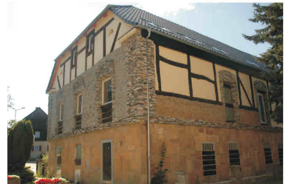
Stronie Śląskie - obiekt usługowy (inwestycja nieukończona). Zauważalne odniesienia do konstrukcji ryglowej.

Altheide-Bad/ Polanica - Zdrój - Pensionsgebäude, freie, von der Fachwerkbaukunst inspirierte Ausschmückung der Außenfassade