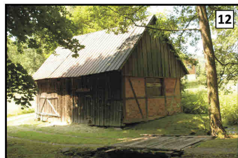
12 Starkówek - ściana ryglowa wolnostojącej szopy Neubatzdorf/ Starkówek - Fachwerkwand einer freistehenden Scheune.