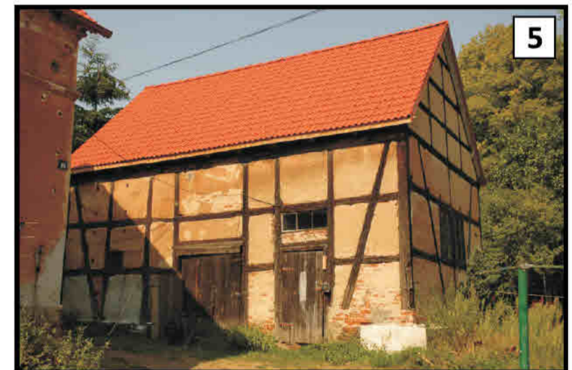
5 Opolnica (pow. Bardo) - jeden z dwóch budynków gospodarczych w konstrukcji ryglowej stajni, przy granicy powiatu kłodzkiego. Giersdorf/ Opolnica (Kreis Wartha/ Bardo) - eines von zwei Wirtschaftsgebäuden eines Gehöfts in Fachwerkbauweise, im Grenzbereich des Glatzer Kreises gelegen.