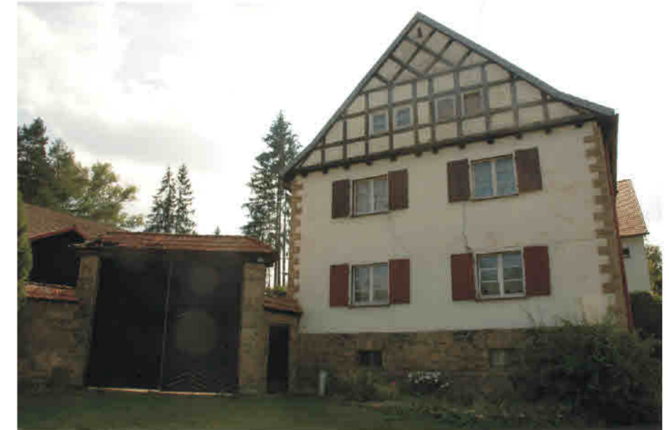
Długopole Górne - gospodarstwo z lat 20 XX w. Oberlangenau/ Długopole Górne - Gehöft aus den 1920er Jahren