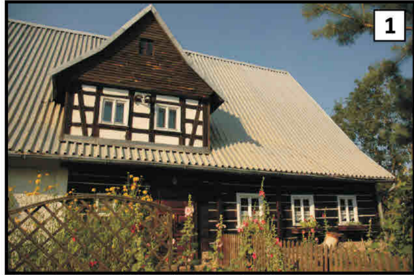
1 Sierpnica (pow. Wałbrzych) - budynek regionalny z pogranicza mikroregionów, niewielki udział konstrukcji ryglowej. Rudolfswaldau/ Sierpnica (Kr. Waldenburg) - regionaler Bau aus dem Grenzbereich zweier Mikroregionen, geringer Anteil an Fachwerk.

źródło/Quelle: H. Franke Ostgermanische Holzbaukultur und ihre Bedeutung für das deutsche Siedlungswerk, s. 104-105, Breslau 1936