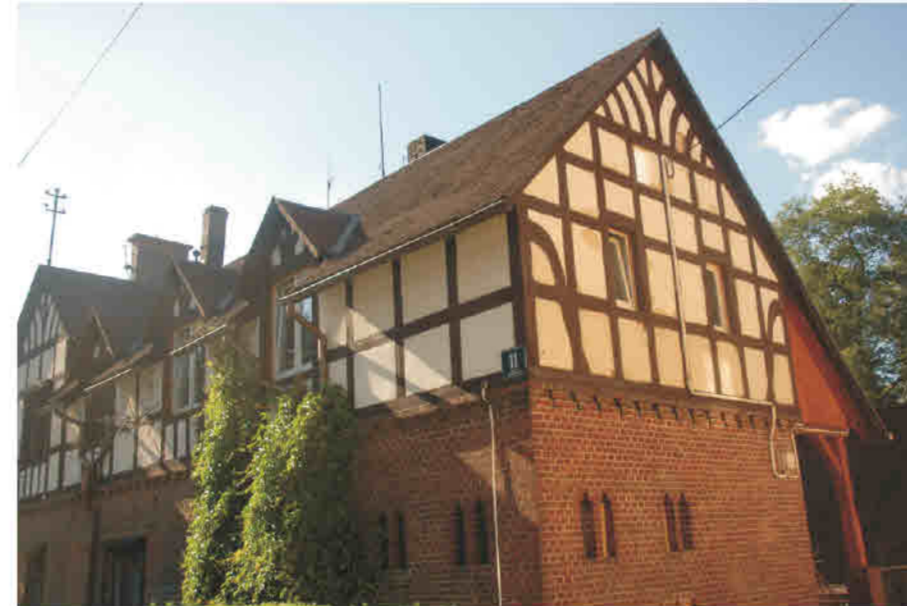
Stronie Śląskie - rezydencja prawdopodobnie z przełomu XIX/XX w. Seitenberg/ Stronie Śląskie - Residenzbau, wahrscheinlich aus der Wendezeit des 19./20. Jahrhunderts