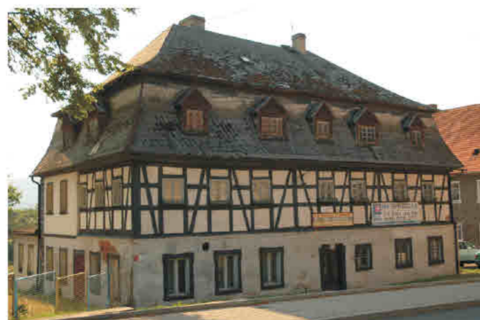
Głuszycza - dawna karczma. Konstrukcja ryglowa na piętrze, dach mansardowy.