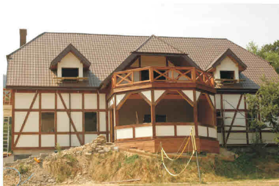
Nowa Łomnica - bud. o funkcjach pensjonatowych (w budowie) imitacja - deski na tynku strukturalnym.

Reigersdorf/ Krosnowice - Einfamilienhaus, Fachwerkimitation - Bretter auf verputzter Wandfläche, die Putzoberfläche imitiert Lehmausfachungen. Die Form des hervortretenden Zwerchhauses folgt dem regionalen Baustil.