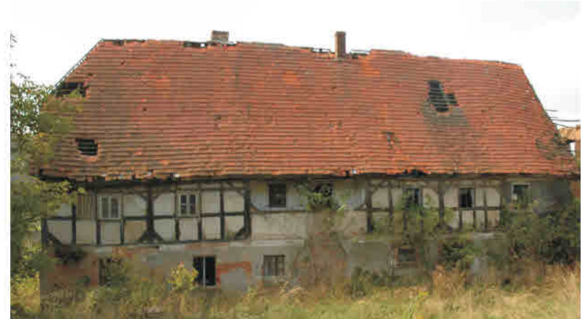
Kondratów - konstrukcja murowo-ryglowa (szachulec), na murowanej ścianie parteru, loggia na piętrze.