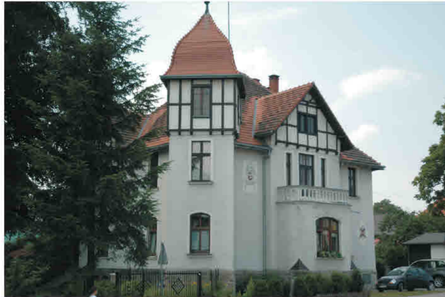
Bystrzyca Kłodzka - willa z przełomu XIX/XX w. Habelschwerdt/Bystrzyca Kłodzka - Villa aus der Wendezeit des 19./20. Jahrhunderts