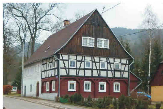
Sokolowsko - konstrukcja mieszana: murowo-przysłupowa, ryglowa na piętrze.

Kulturelle Einflüsse aus Süddeutschland, der Lausitz und Böhmen. Ein- und zweigeschossige Bauten. Im Erdgeschoss in Blockbauweise, in Mischkonstruktion (Blockbau- und Umgebinderkonstruktion, überwiegend mit langen Streben) bzw. in Massivbauweise erbaut (einige wenige Erdgeschosswände in Fachwerkbauweise mit Lehmausfachungen). Die Riegel führen auf der gesamten Wandfläche über die Stiele hinweg, die Erdgeschosswände sind massiv gemauert (schlesisches Fachwerk). Einfache Satteldächer und Krüppelwalmdächer.