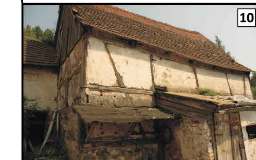
10 Żelazno - budynek gospodarczy w zagrodzie. Eisersdorf/ Żelazno - Wirtschaftsgebäude in einem Gehöft.