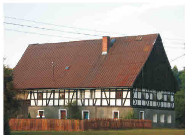
Czernica - budynek w konstrukcji mieszanej ryglowo-murowej, szczyt szalowany deskami.

Kulturelle Einflüsse aus Süddeutschland und der Lausitz. Auftreten von Bauten in Block-, Umgebinder- und Massivbauweise. Fachwerkkonstruktionen in zwei Ausprägungen: einerseits in einfacher, schlichter Form, unter sparsamer Verwendung von Baudetails, ohne Streben, in Verbindung mit Umgebinderkonstruktionen mit kurzen Streben und massiv gemauerten Ausfachungen im Erdgeschoss; andererseits mit komplizierter Skelettgliederung, in Kombination mit Umgebinderkonstruktionen mit langen Streben, Baudetails: Lauben, Balkone, Loggien.