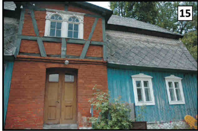
15 Szczytna - ryzalit z lukarną w konstrukcji ryglowej budynku regionalnego Rückers/ Szczytna - Risalit mit Zwerchhaus in Fachwerkkonstruktion an einem Regionalbau