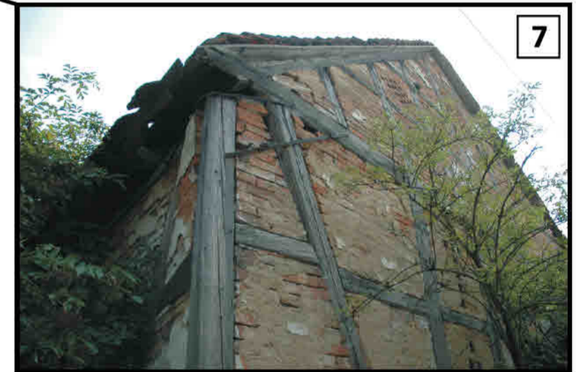
7 Wojciechowice - wozownia w konstrukcji ryglowej, w zagrodzie 3- obiektowej. Königshain/ Wojciechowice - Remise in einem Dreiseithof.