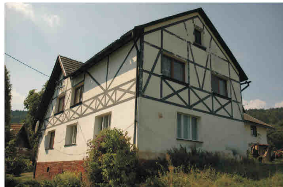
Włodowice - budynek mieszkalny w zagrodzie z przełomu XIX/XX w. Imitacja konstrukcji ryglowej w formie dekoracji malarskiej.

Woldenstein/ Włodowice - Wohngebäude in einem Gehöft aus der Wendezeit des 19./20. Jahrhunderts. Fachwerkimitation mit Hilfe eines dekorativen Farbanstrichs