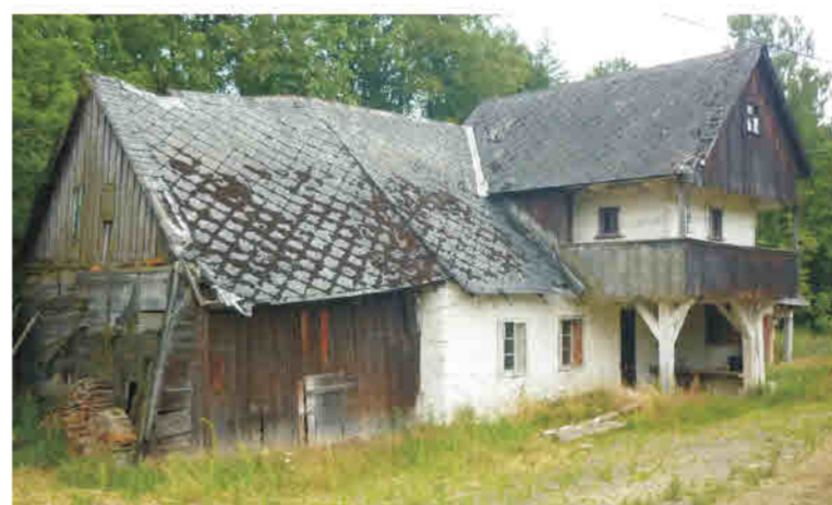
Stary Gieraltów - konstrukcja wieńcowo - murowa, wyżka z galerijką pod okapami, wsparta na słupach.