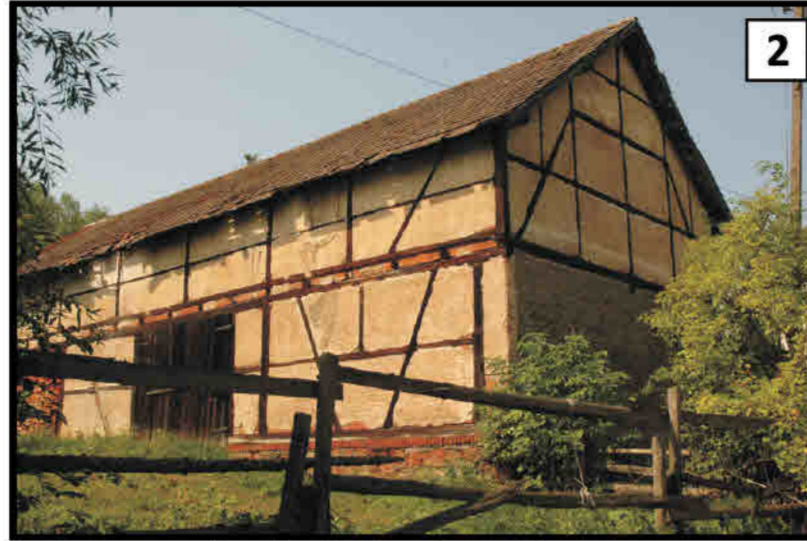
2 Łączna - wozownia w 3 - obiektowej zagrodzie. Wiesau/ Łączna - Remise in einem Dreiseithof.