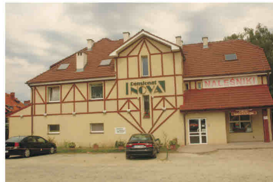
Polanica - Zdrój - pensjonat. Fantazyjna dekoracja fasady inspirowana konstrukcją ryglową

Seitenberg/ Stronie Śląskie - Dienstleistungsgebäude. Sichtbare Anknüpfungen an die Fachwerkbaukunst.