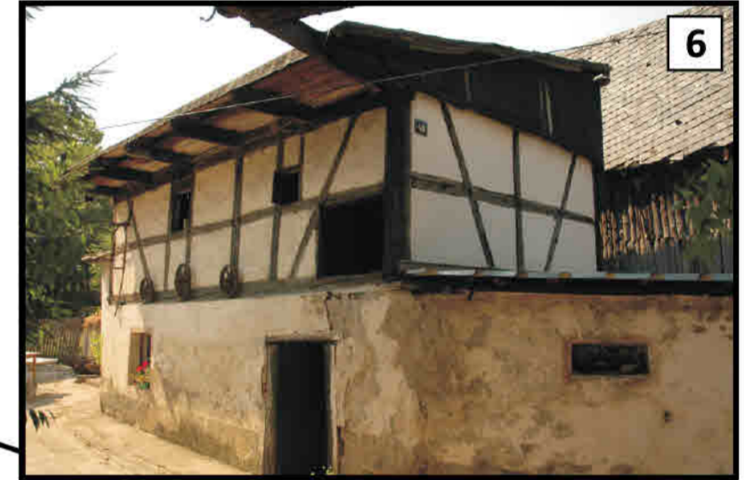
6 Opolnica (pow. Bardo) - pierwotnie budynek mieszkalny, z roku 1794. Giersdorf/ Opolnica (Kr. Wartha/ Bardo) - ehemaliges Wohnhaus von 1794.