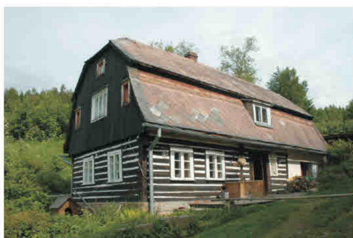
Wójtowice - konstrukcja wieńcowo-murowa, dach mansardowy, szczyt oszalowany deskami.

Einflüsse böhmischer Kultur. Meist eingeschossige Wohn- und Wirtschaftsbauten in Blockbauweise sowie in Mischkonstruktionen (teils Blockbauweise, teils massiv bzw. teils Blockbauweise, teils Fachwerkkonstruktion mit Verbräuerungen). Seltener zweigeschossige Bauten in Blockbauweise (Erd- und Obergeschoss bzw. Obergeschoss in Blockbauweise über massiv gemauertem Erdgeschoss). Die Fachwerkbauweise tritt (vereinzelt) im nördlichen Teil der Region auf. Einfache Satteldächer, Krüppelwalmdächer, Satteldächer mit Aufschieblingen (die die Traufe bilden), Mansarddächer. Originelle Baudetails, die mit böhmischen Einflüssen in Verbindung gebracht werden: Galerien, Laubengänge, vor die Mauerflucht hervortretende Obergeschoss- bzw. Giebelwände, Farbigkeit der Fassaden: Hervorhebung der dreieckigen Giebelwand, charakteristische Betonung der Leisten an den Berührungsflächen der Bretter (Giebelwände, Brüstungen).