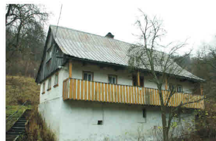
Nowa Bystrzyca - konstrukcja wieńcowo na wysokim cokole, galerijka podwieszona do okapu.