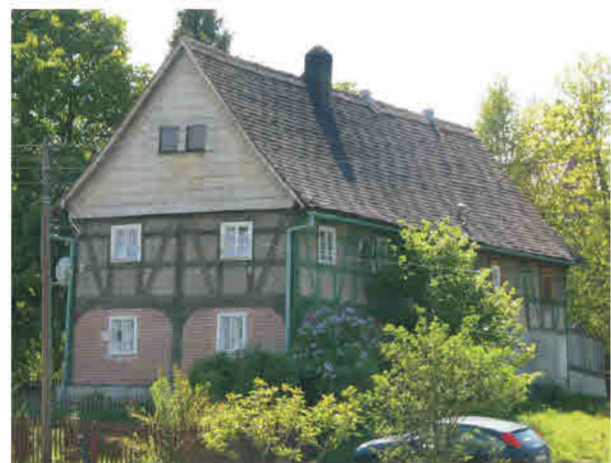
Ręczyn - konstrukcja przysłupowo-ryglowa. Ściany przysłupowe wypełnione cegłą.