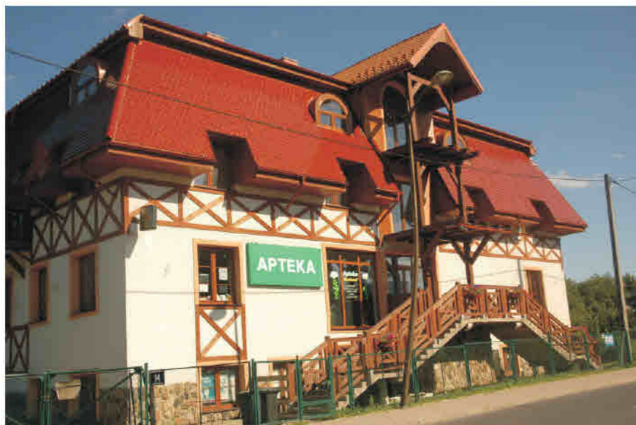
Stronie Śląskie - Budynek usługowy, inspiracja detalem konstrukcji ryglowej.

Neurode - Schlegel/ Nowa Ruda - Stupiec - Dienstleistungsgebäude, das Elemente der regionalen Baukunst der Grenzregion Glatz/Waldenburg aufgreift, Fachwerkkonstruktion im Obergeschoss.