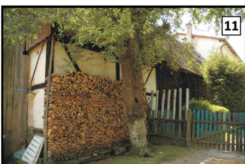
11 Szklarka - część gospodarza 1 - obiektowej zagrody. Glasendorf/ Szklarka - Wirtschaftsteil eines Wohn- und Wirtschaftsgebäudes.

OPRACOWANY OBSZAR Untersuchtes Gebiet GRANICA PAŃSTWA Staatsgrenze GRANICA POWIATU KŁODZKIEGO Grenze des Kreises Glatz