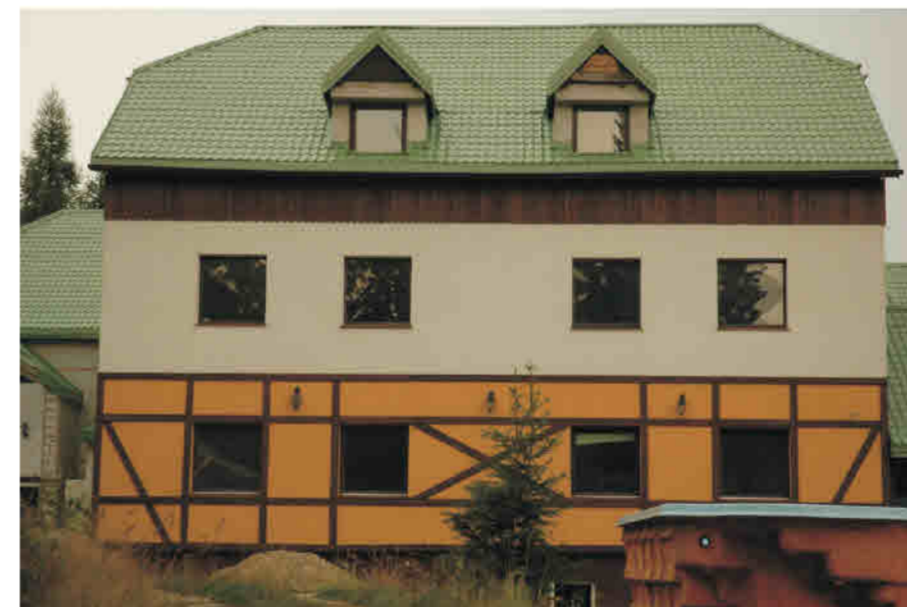
Zieleniec (Duszniki Zdr) - pensjonat z lat 90 XX (w budowie). Dekoracja inspirowana konstrukcją ryglową w poziomie parteru.

Grunwald/ Zieleniec (Bad Reinerz/ Duszniki Zdrój) - Pensionsgebäude aus den 1990er Jahren. Fachwerkimitation mit Hilfe eines dekorativen Farbanstrichs