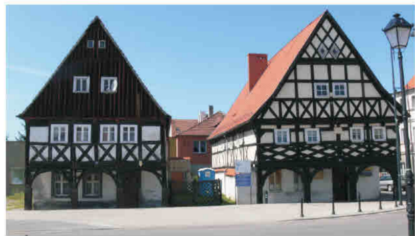
Sulików - miejskie domy podcieniowe, konstrukcja murowo-ryglowa, szczyty ryglowy i szalowany deskami.

Einflüsse der Oberlausitzer Baukunst. Zweigeschossige Wohn- und Wirtschaftsbauten (Weberhäuser). Das Erdgeschoss in Umgebinderkonstruktion mit kurzen Riegeln, geschwungenen Streben, oftmals massiv (meist in Folge der Ausfachung der Holzkonstruktion mit Mauerwerk). Das Obergeschoss in Fachwerkbauweise mit Lehmausfachungen.