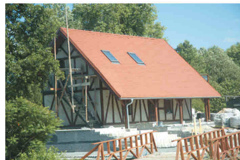
Idzików - budynek jednorodzinny (w budowie), imitacja: deski na tynku.

Neu Lomnitz/ Nowa Łomnica - Pensionsgebäude (im Bau), Fachwerkimitation - Bretter auf Strukturputz.