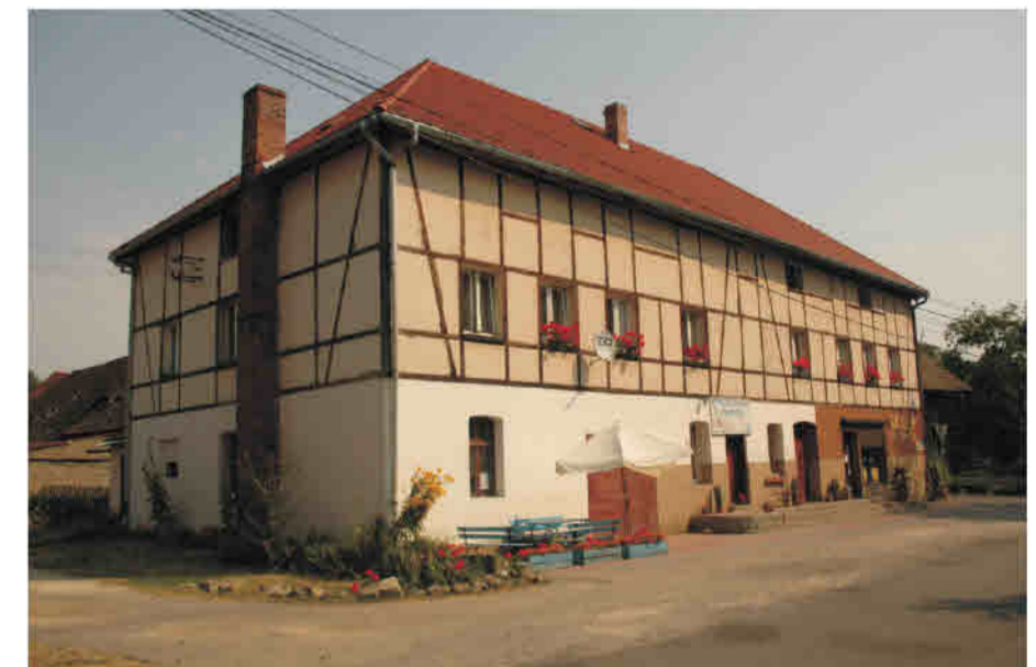
Stara Bystrzyca - Dawna gospoda z XIX w. adaptowana w latach 90 XX w. na cele mieszkalne, dekoracja w formie konstrukcji ryglowej w poziomie piętra.

Grunwald/ Zieleniec (Bad Reinerz/ Duszniki Zdrój) Pensionsgebäude aus den 1990er Jahren (im Bau), Fachwerkimitation - Bretter auf Strukturputz.