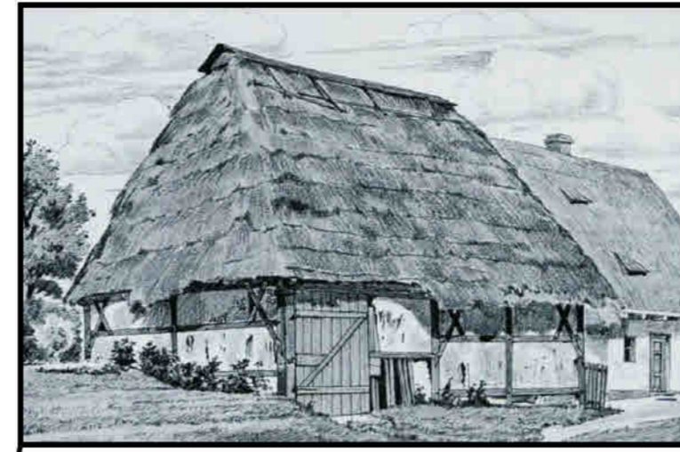
Bożków - nieistniejąca szopa w konstrukcji ryglowej z charakterystycznym stromym, czterospadowym dachem, relikw. Porównywana do obiektów z okolic Cottbus, Olbersdorf (k. Zittau) i Hain (Przesieka k. Jeleniej Góry).

Im Rahmen einer Studie wurden 78 Ortschaften im Kreis Glatz/ Kłodzko unter dem Gesichtspunkt ihres Bestandes an Fachwerkbauten mit Ziegel- bzw. Lehmausfachungen untersucht. Die Gesamtsumme aller Bauten, die Elemente einer Fachwerkkonstruktion aufweisen, beträgt 16. Innerhalb des aus der Zeit vor 1945 stammenden Baubestands bilden Fachwerkbauten auf dem untersuchten Gebiet einen Anteil von nicht mehr als 0,5% (*). Es ist anzunehmen, dass die Fachwerkbauweise in den Ortschaften des nördlichen Grenzbereichs der Grafschaft Glatz häufiger (dennoch vereinzelt) auftrat, was sowohl von Schriftquellen als auch durch Aussagen der Bewohner bezeugt wird. Die Zahl der Fachwerkbauten hatte keinen Einfluss auf die Herausbildung der architektonischen Eigenständigkeit des Glatzer Landes.