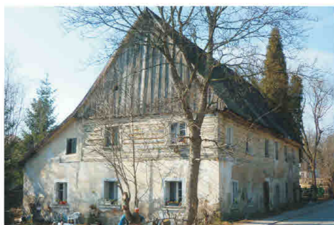
Duszniki-Zdr. piętro budynku w konstrukcji wieńcowej.