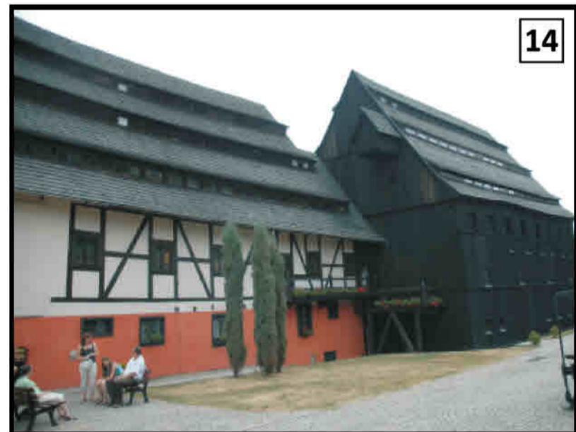
14 Duszniki-Zdr. - ściana ryglowa młyna papierniczego z 1605 r. Bad Reinerz/ Duszniki-Zdrój - Fachwerkwand einer Papiermühle von 1605.