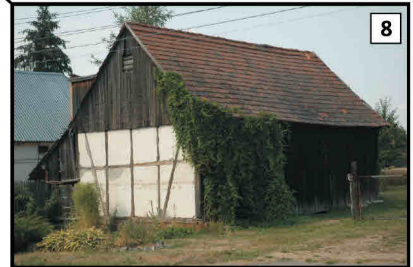
8 Jaskowa Dolna - ściana ryglowa stodoly. Niederhansdorf/ Jaskowa Dolna - Fachwerkwand einer Scheune.

OPRACOWANY OBSZAR Untersuchtes Gebiet GRANICA PAŃSTWA Staatsgrenze GRANICA POWIATU KŁODZKIEGO Grenze des Kreises Glatz