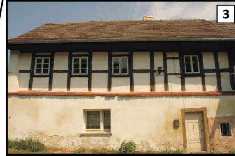
3 Łączna - jedyny zlokalizowany budynek mieszkalny w powiecie z elementami konstrukcji ryglowej. Wiesau/ Łączna - einziger lokalisierter Wohnbau des Kreises mit Elementen einer Fachwerkkonstruktion.