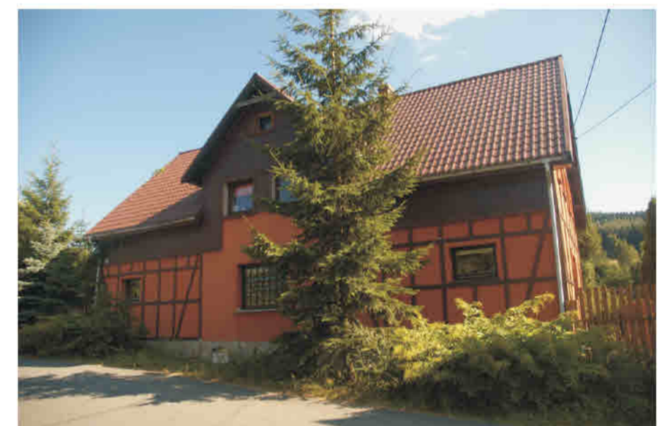
Nowy Gierałtów - budynek mieszkalny sprzed 1945 r. po renowacji imitacja konstrukcji ryglowej - nowy element w elewacji budynku.

Kieslingswalde/ Idzików - Einfamilienhaus (im Bau), Fachwerkimitation - Bretter auf verputzter Wandfläche.