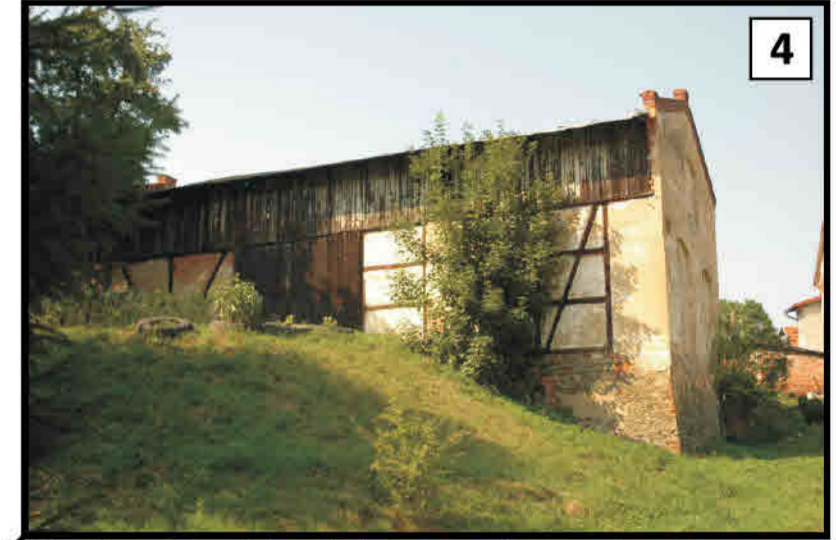
4 Młynów - elementy konstrukcji ryglowej wozowni. Mühldorf/ Młynów - Remise mit Fachwerkanteil.