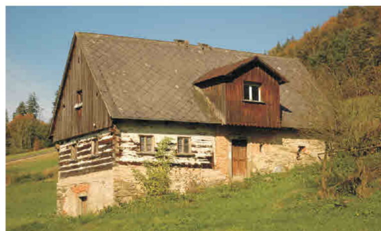
Nowy Waliszów - konstrukcja wieńcowo-murowa na wysokim cokole, wyżka zabudowana.